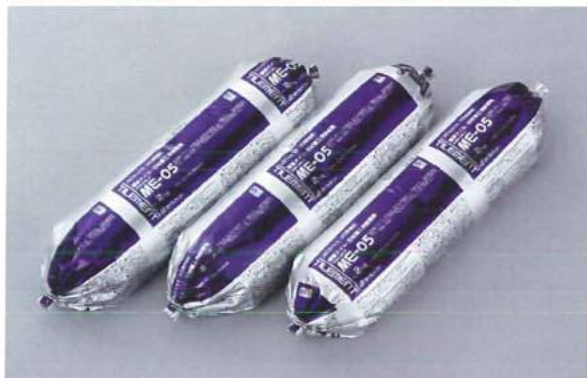
変成シリコーン樹脂系接着剤

屋外壁面へのタイル・石材施工用(落下防止金物併用)として開発された、一液反応硬化形の変成シリコーン・エポキシ樹脂系接着剤です。硬化性に優れ、硬化後は適度な硬さを保持することで、接着強さを確保しつつ、下地の変形や仕上げ材の動きによる応力を緩和します。