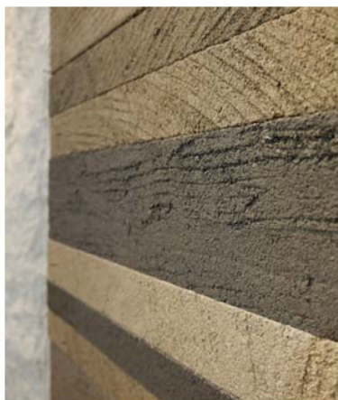
マグ・アートパネル/コーヒー