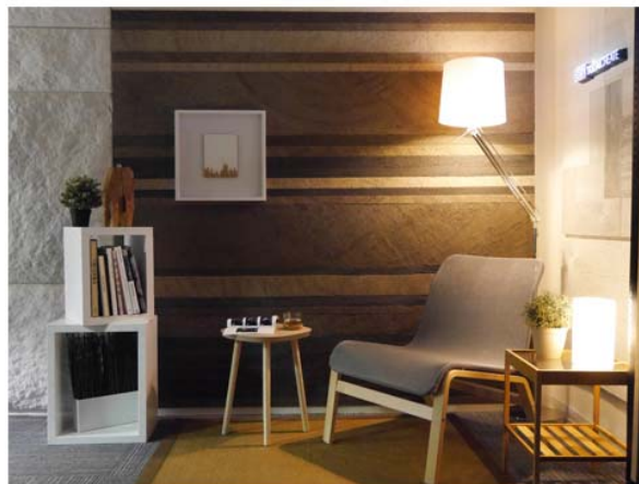
マグ・アートパネル/コーヒーによるインテリアイメージ