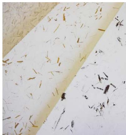
マグ・アートパネル/ナチュラル